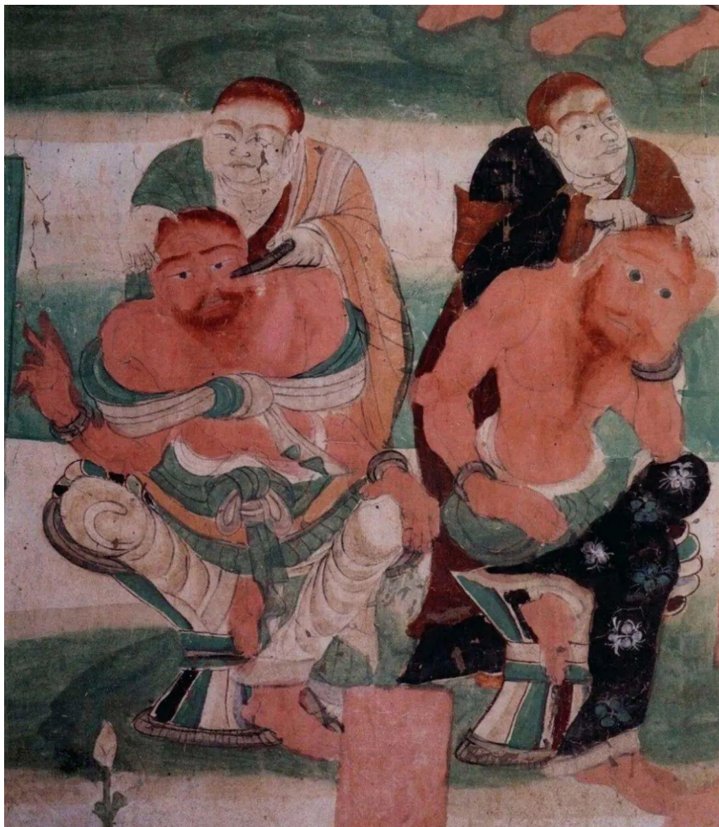
瓜州榆林窟第16窟“红发外国人剃头刮胡子”

敦煌壁画中还留下了很多生动的外国人在中国生活的场景。例如，在瓜州榆林窟第16号窟里，我们就看到一幅壁画描绘红头发的外国人剃头、刮胡子的场面。画上这两个外国人的眼睛是绿色的，头发和胡须是红色的。不知道他们是不是红发爱尔兰人？这两个外国人原本是做生意到中国来的，但却要在这里剃头出家做和尚，剃掉他们红色的胡子和头发。这个场景，是一个外国人在中国生活的生动再现。