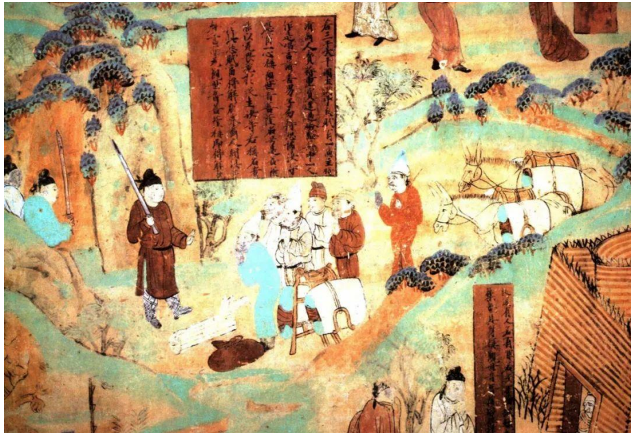
敦煌莫高窟盛唐第45窟“胡商遇盗”

重、相互欣赏、相互交流的精神。中外人士在五台山交流经验，交流智慧。这个故事，最后变成了一个不同国家之间人们思想交流、文化交往、美美与共、文明互鉴的故事，一个文化象征和文明缩影。