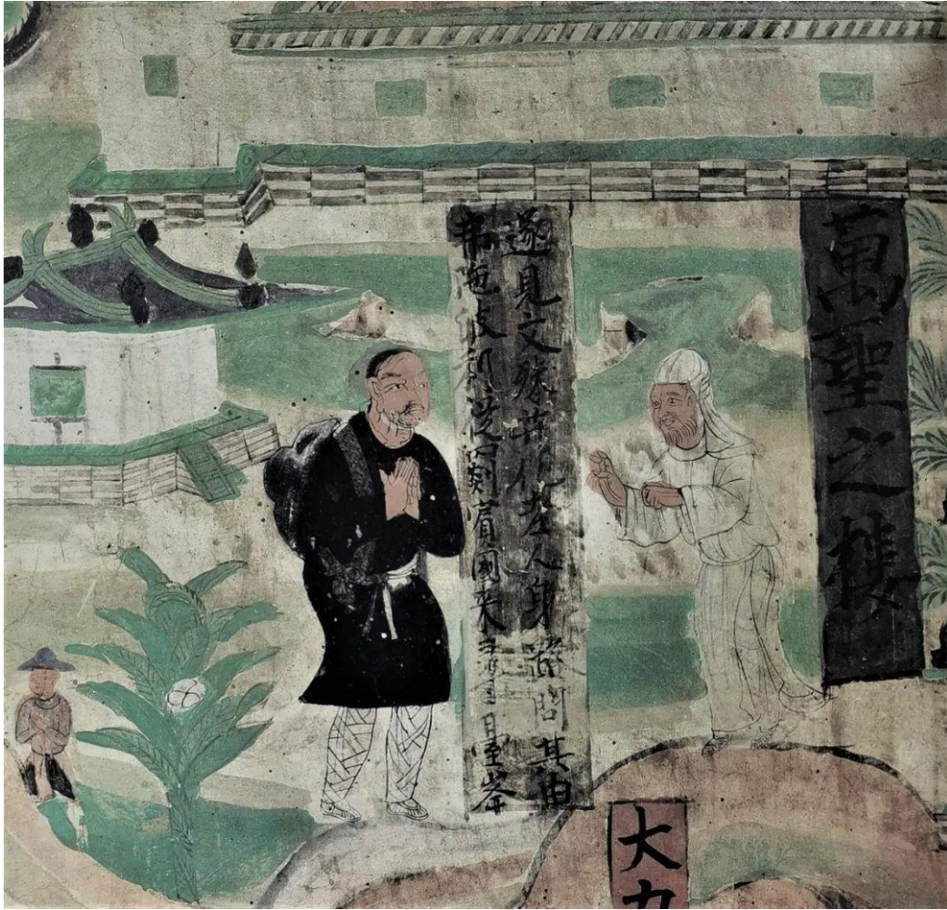
敦煌莫高窟五代时期第 61 窟“阿富汗僧人来山西五台山朝拜”

敦煌莫高窟五代时期的第 61 窟的西壁上，画了一个特别生动有趣的故事。讲的是一个来自阿富汗的僧人，名叫佛陀波利，他听说在中国山西的五台山，有个文殊菩萨的道场，在那里可以学到很高深的佛学。所以，他就不远千里，从阿富汗步行到了中国的五台山，他到达的时候，奇迹发生了，文殊菩萨化身成了一个穿着白色衣服的老人，留着长胡须，是充满智慧和经验的长者形象。老人告诉他，你需要回到阿富汗，把本国的知识，也就是一部佛经，叫做《佛顶尊圣陀罗尼经》，带到中国来，交给中国的皇帝，让官方翻译成中文，流行中华大地。佛陀波利便回到了阿富汗，取来了佛经，送到唐高宗的宫廷，官方组织翻译团队译成中文，流行中土。