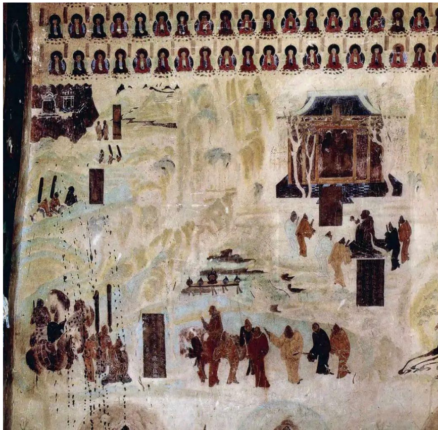
敦煌莫高窟初唐第 323 窟“张骞出使西域”

敦煌石窟是中国传统艺术的瑰宝，也是世界文明史上极为难得的图像宝库。敦煌莫高窟现在仍然保存有 2 千多身彩塑和 5 万多平方米壁画，时间跨度从公元 5 世纪到 14 世纪，长达近千年。我们在敦煌壁画里，不仅可以看见中国古代社会发展演变的真实风貌，还可以见到大量古代陆地丝绸之路和海上交通贸易的生动场景。可以说，敦煌壁画里有我们现在“一带一路”倡议和实践的“古代版”。这些生动有趣的图像资料，不仅映证了“一带一路”曾经的繁荣昌盛，也蕴藏了值得我们借鉴的历史经验和教训，特别有价值。