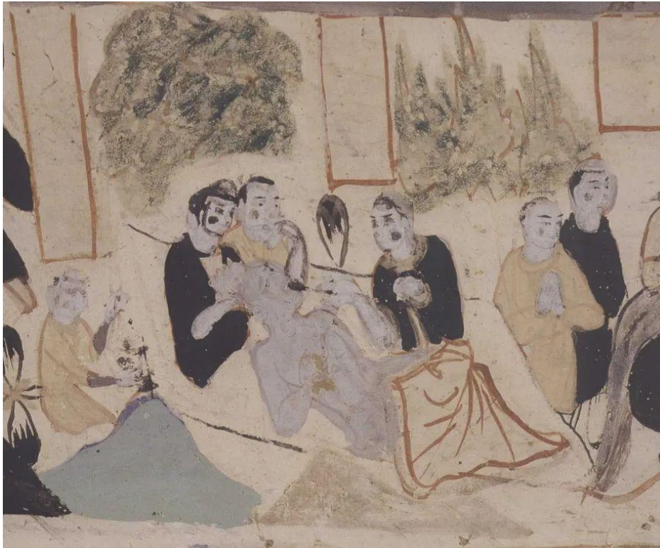
敦煌莫高窟北周第 296 窟“救治外国商人”

在敦煌莫高窟北周时期的第 296 窟的顶上，还有一幅感人的画面，那是一幅敦煌本地人救治外国商人的画面。画上有一个人身材特别高大的外国商人在敦煌这个地方生了病，躺在路边。这时，本地的中国人就来帮助他，男男女女的本地人在地上铺了一张地毯，让他躺着舒服一些，然后把他扶起来，有一个中国的医生拿了一把很长的勺子喂病人喝汤药。用勺子喂药，一看就是中国传统的中医药，因为，中国传统医药都是要把药材熬成汤，熬成液体，必须要用勺子来喂。所以，我们看到一个外国商人，尽管身体很健壮，但是，在旅途劳顿的情况下也可能会生病、需要本地人的帮助。而且，中国人一向都是以同情的、友善的态度来对待这些东来西往的商人的。我们发现，艺术家在画这幅画的时候有一些夸张，因为在本地人的心目中，西边来的这些商人们，个子要比本地的中国人更高大。画上的病人一看就是外国人，可能有两米多高的样子，他的上半身裸露，可以看见肌肉发达、双肩挺拔，头也很大，这一看就是一个外国来的商人。但是，他病了也需要本地人的帮助，而本地的医生不仅给他看病，还给他熬药，并用勺子亲自喂他。这样就留给观众以期待，期待这个生了病的商人会很快康复并完成他的商务之旅。