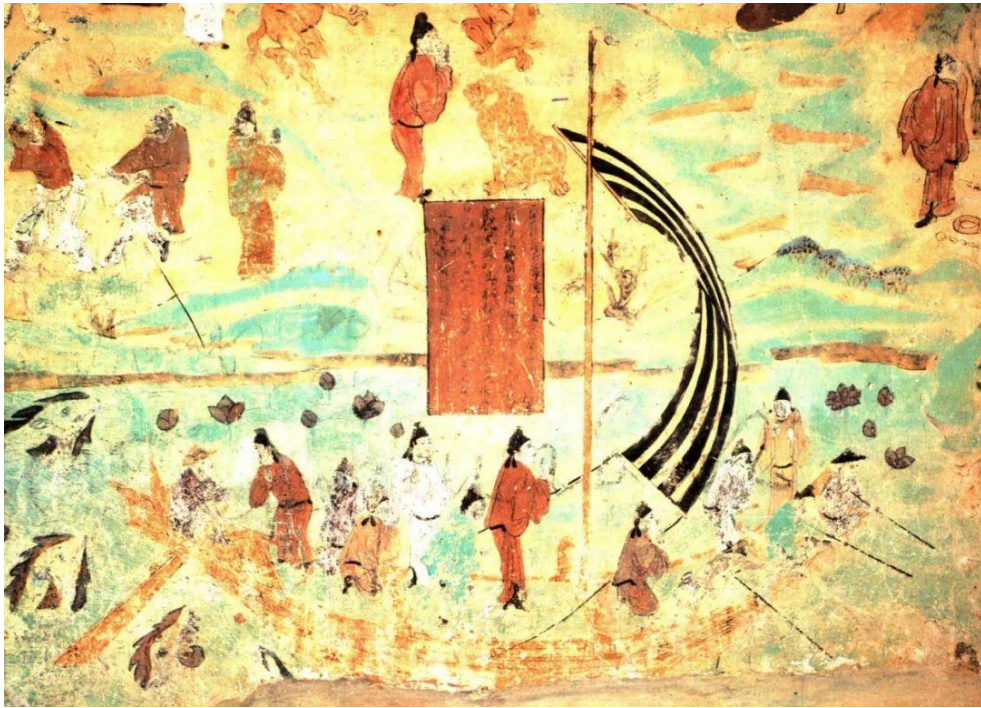
敦煌莫高窟盛唐第45窟“海船遇难”

我们在敦煌壁画当中，也可以看到一些海上丝绸之路的场面，主要是表现商人们乘大船到大海中去寻找宝贝，或者是去做海外的贸易。例如，在敦煌莫高窟盛唐第45窟里，我们就看见有一幅“海船遇难”图。画中的海船是很大的船，在海上航行，有一根很高的桅杆，桅杆上悬挂宽大的船帆，这个帆在劲风吹拂下变成了一张弓形，显示这只船航行的速度很快。同时，船上有艄公在掌舵，还有人在划船，帮助提升航行速度。航海的人也会遇到各种危险：比如狂风巨浪会毁坏船只、海中的危险动物如鲨鱼、漩涡湍流等都会对海上的贸易造成很大的困难。但是，这些渴望贸易交流的人们是不会惧怕这些风险的，他们有自己的欲望，有自己的精神支撑，最后通常都能平安的完成自己的使命。所以，我们今天倡导的一带一路，海上和陆地上的跨国、跨地区商贸往来，都可以在敦煌古代壁画上找到古代的影子。