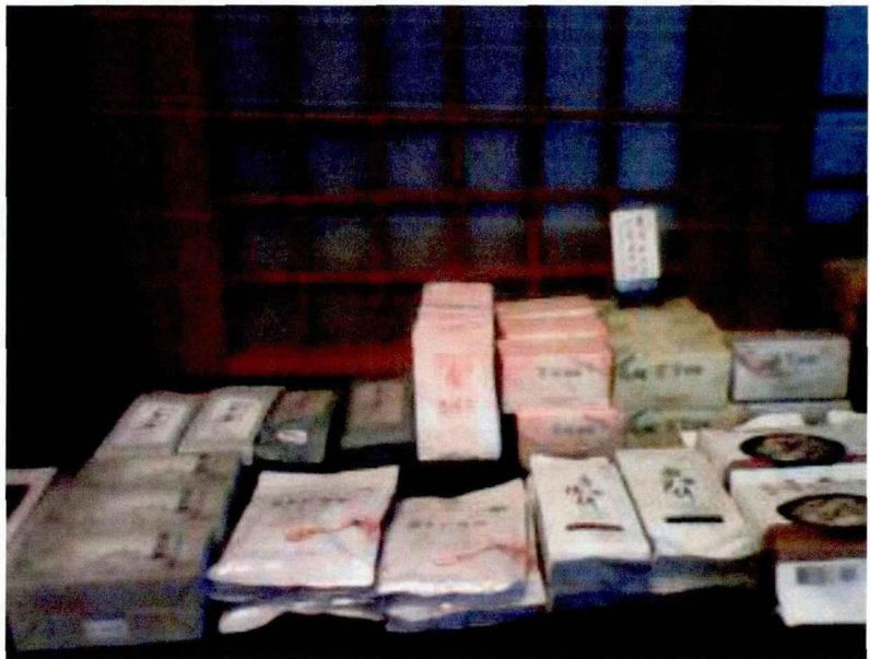
图 4 慈济基金会昆明会所推广使用的环保物品