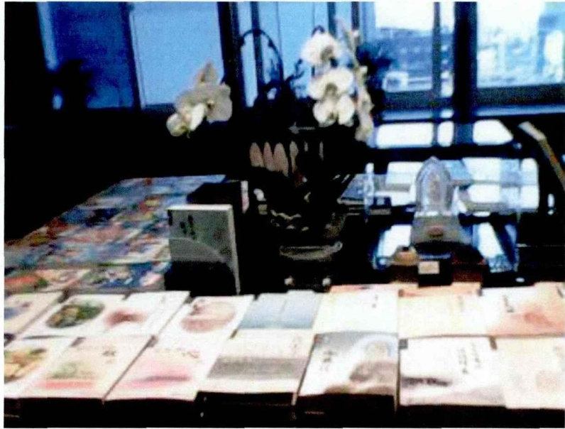
图 3 慈济基金会昆明会所推广售卖的慈济书籍